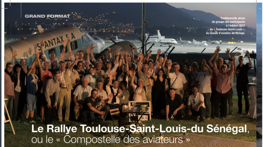
Traditionnelle photo de groupe des participants à l'édition 2017 du « Toulouse-Saint-Louis », au musée d'aviation de Malaga.