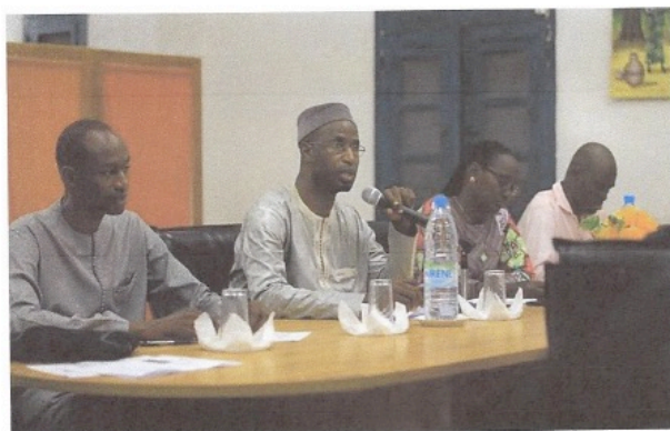
Un autre aspect du rallye aérien Toulouse-Saint Louis du Sénégal.

De fidèles participants du Rallye Toulouse - St-Louis ont proposé une conférence sur l'amélioration de la sécurité en milieu hospitalier, via des méthodes communément utilisées dans l'aérien. Plus de 50 médecins ont fait le déplacement à l'Hôpital Régional de Saint-Louis.