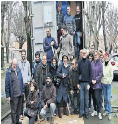
Internes et bénévoles salariés de Claudius Regaud ont rempli le container fin janvier. Il sera au Sénégal la semaine prochaine.